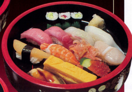
トロ2個入り、美味しさ1.5倍。 写真 上にぎり(1.5人前)……3,240円 特上にぎり(1.5人前)……3,942円 中にぎり(1.5人前)……2,592円 並にぎり(1.5人前)……1,890円