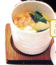
茶わん蒸し……540円 (温かいまま、お届けします。)