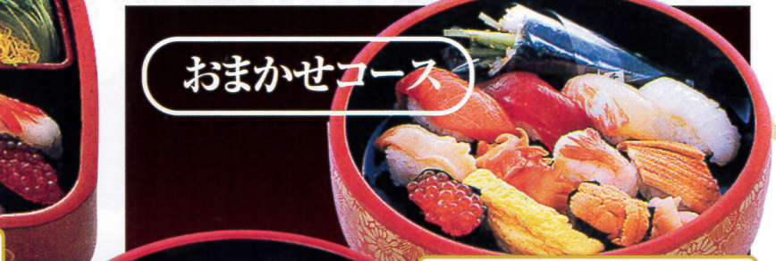
季節のおまかせ12種類。 菊コース……3,564円 おまかせコースのため、内容は季節仕入等 により異なります。写真は商品イメージです。