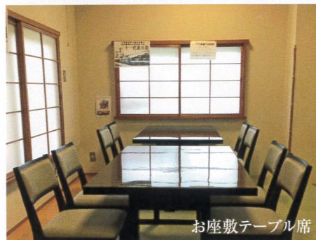
お座敷テーブル席