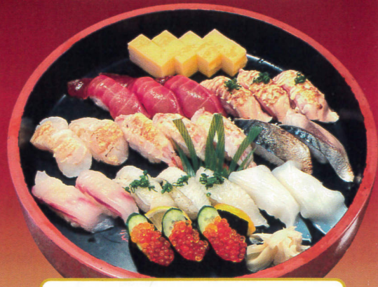
当店オリジナル。 まつり(炙りすし入り3人前)……5,400円