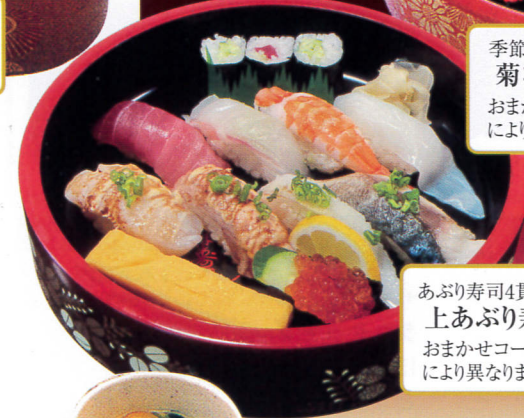
あぶり寿司4貫入り。 上あぶり寿司コース……2,376円 おまかせコースのため、内容は季節仕入等 により異なります。写真は商品イメージです。