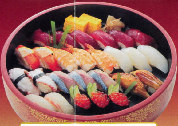
すみれ(3人前)……4,590円 赤身、いくら、白身、えび、いか 穴子、玉子焼、サーモン、たこ、青魚