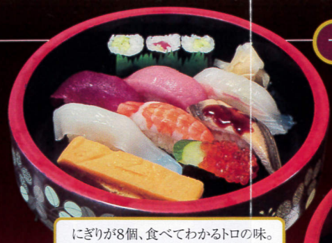
にぎりが8個、食べてわかるトロの味。 写真 上にぎり……2,160円 中にぎり……1,728円 並にぎり……1,296円