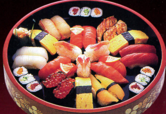
ぎんかく(3人前)……6,750円 とろ、赤身、サーモン、いか、白身、穴子、 数の子、いくら、甘えび、玉子焼、巻物3種。