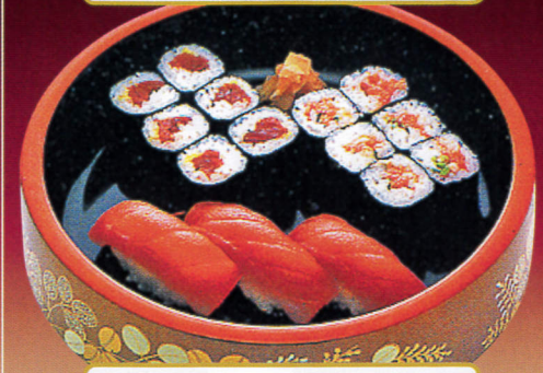
まぐろの味わい、いろいろ。 まぐろづくし……1,620円