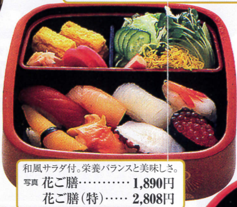
和風サラダ付。栄養バランスと美味しさ。 写真 花ご膳……1,890円 花ご膳(特)……2,808円