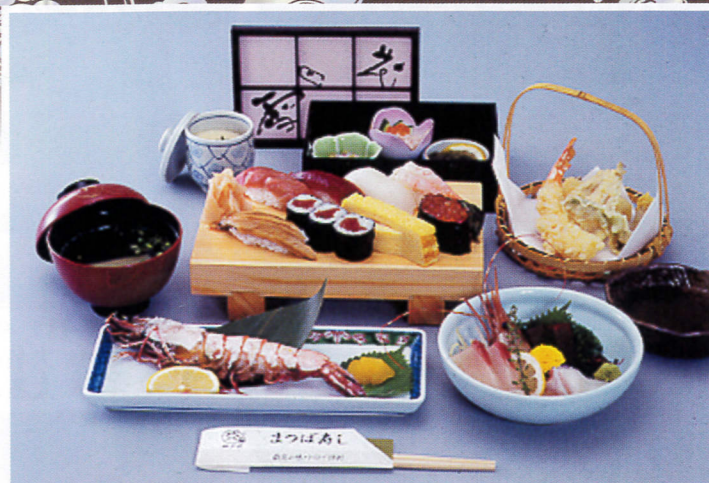
宴会料理 5,200円+税 (季節により、お料理内容に多少の変更がございますのでご了承ください。)