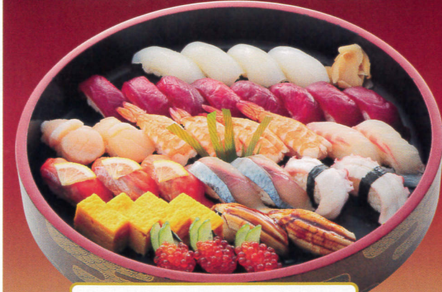
あさがお(4人前)……6,264円 赤身、ほたて、いくら、白身、えび数の子、いか 穴子、玉子焼、サーモン、たこ、青魚