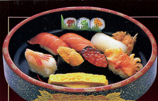
選りすぐりの素材で、おいしさ満開。 写真 特上にぎり……2,700円