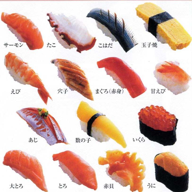
サーモン たこ こはだ 玉子焼 えび 穴子 まぐろ(赤身) 甘えび あじ 数の子 いくら 大とろ とろ 赤貝 うに