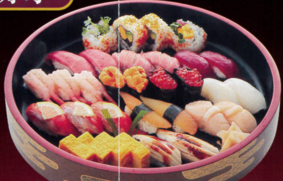
さくら(上寿司3~4人前相当)……7,128円 とろ、赤身、甘えび、ほたて、いくら、数の子 いか、穴子、玉子焼、サーモン、うに、巻物