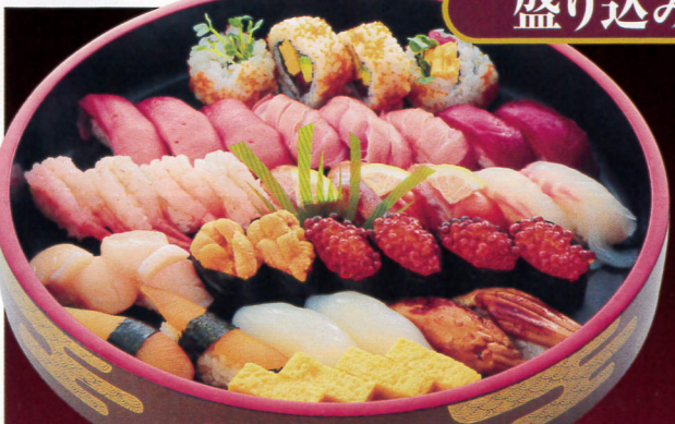
あおい(特上3~4人前相当)……9,720円 とろ、赤身、甘えび、サーモン、白身、ほたて、うに、 いくら、数の子、いか、穴子、玉子焼、巻物